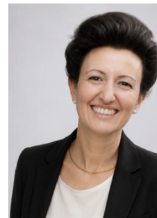
FERRARI ROSALBA Sezione A n.4309